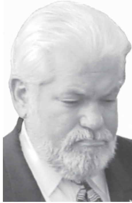
Superintendent of Schools Wilfredo T. Laboy

Out of 44 Administrators, 98% are White and 2% Latino. 88% of the 1,087 teachers are White and 11% Latino; there