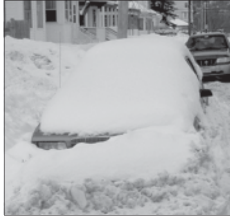
Este auto estuvo en la Calle Tekwsbury en South Lawrence por 8 días después de la última tormenta de nieve.

Ciertamente que si los camiones de la ciudad recogen la nieve se debe tratar de que existan lugares donde depositarla y no arrojarla en las aceras, pero si el propietario de vivienda o dueño de negocio en lugar de cooperar para despejar las aceras y las