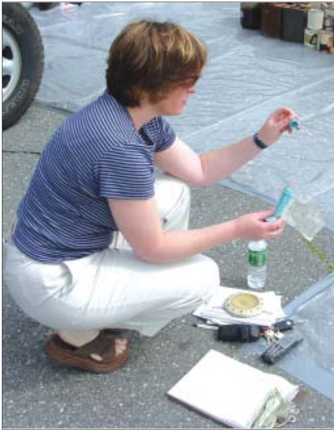
La Ciudad de Lawrence llevó a cabo su colecta anual de desperdicios tóxicos en el estacionamiento del Parque Pemberton. (Página 7)