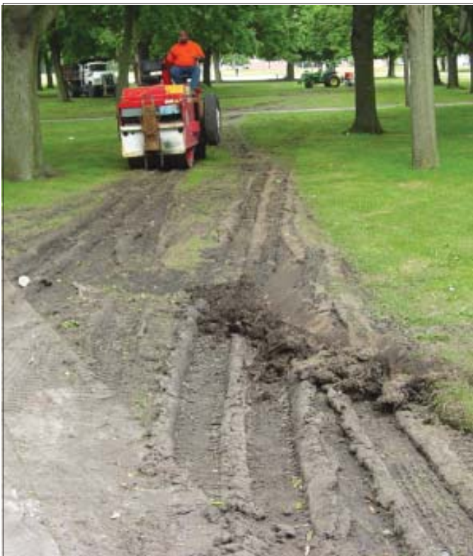
El festival de este año causó grandes estragos al Parque Campagnone. (Página 3)