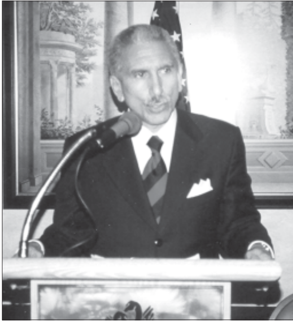
Enmanuel Esquea Guerrero, precandidato del PRD a la presidencia de la República Dominicana.