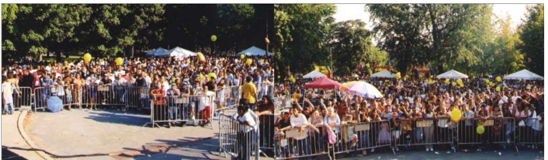
Vistas del público que llenó el Campagnone Common y algunos de los artistas que se presentaron en Fiesta 2003.