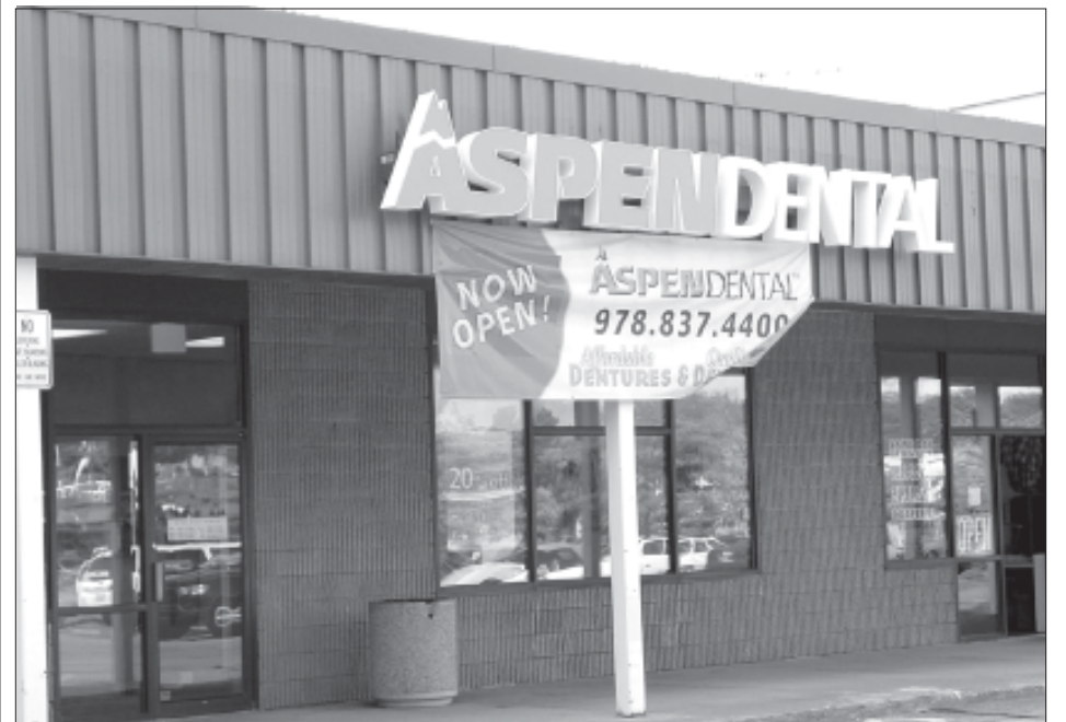
Las nuevas oficinas dentales están localizadas en Merrimack Plaza, en el 162 de la Calle Haverhill, en Methuen.

Para más información, vea www.aspendental.com o escribanos al correo electrónico Ibeale@aspendental.com