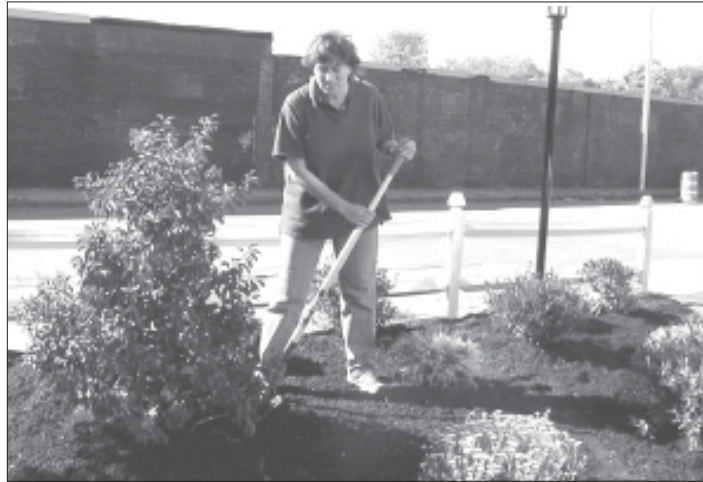
La Presidenta de Mary Immaculate Health/Care Services hizo uso de la pala limpiando el jardín alrededor del área de Bennington y Lawrence Street, como parte del día de mostrar que en María Inmaculada se preocupan.