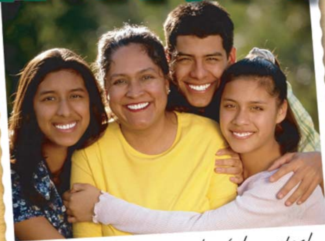
Cumpleaños de mamá. ¡cuántas velas!