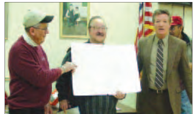
También recibió una gigantesca postal firmada por todos los asistentes, deseándole un feliz cumpleaños. He also received a giant post card signed by all.