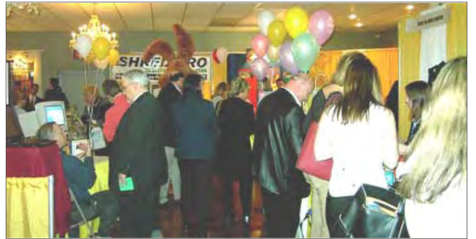
Partial view of the public in attendance to this year's Spring Business Expo sponsored by the Merrimack Valley Chamber of Commerce held at Pat's Function Hall in Haverhill.