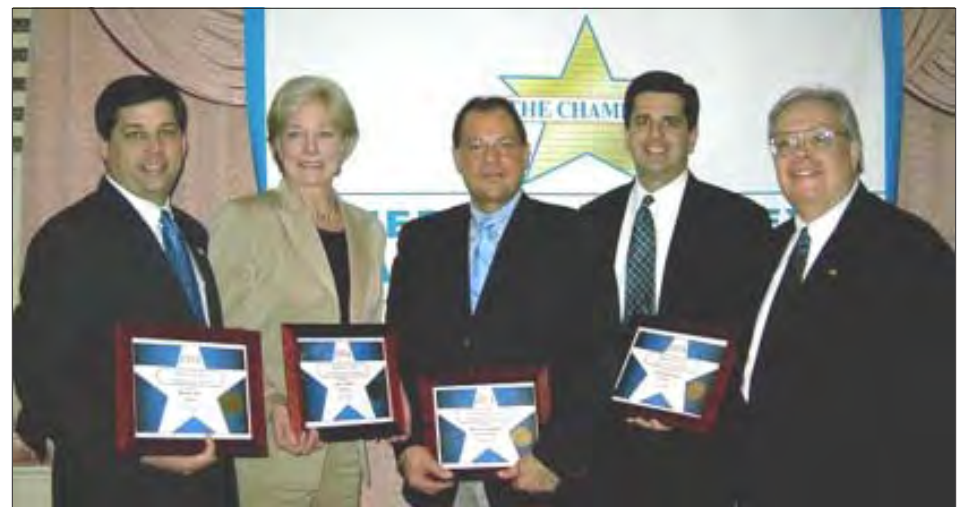
The Government Affairs Committee recognized the assistance of the many legislators assisting in the Chamber's educational forums. Among them are Senator Bruce Tarr, Senator Sue Tucker, Senate President Robert Travaglini, Senator Steven Baddour and Joe Bevilacqua, president of the Merrimack Valley Chamber of Commerce.