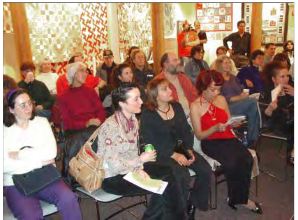
Parte del público asistente.

A pesar de que la mayoría de la audiencia no entendía español, demostró disfrutar a plenitud del ritmo contagioso de la música jíbara como el aguinaldo y el seis, emanado del cuatro puertorriqueño.