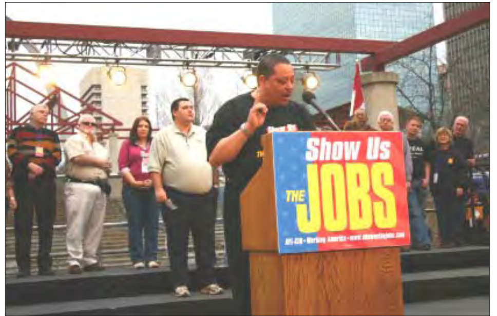
Demostraciones similares a esta tuvieron lugar por 18 ciudades de los Estados Unidos.

280 Haverhill St., Lawrence, MA - (978) 685-5366