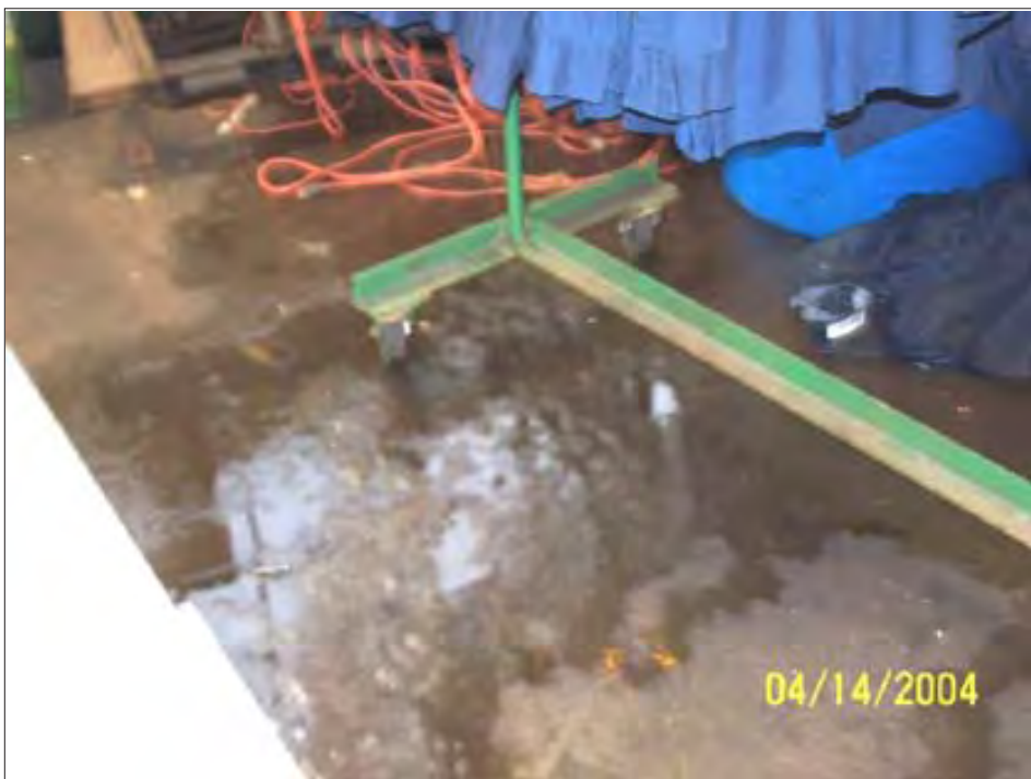
Another aspect of the wet floor at the Municipal Garage as a result of the rain coming through the roof.