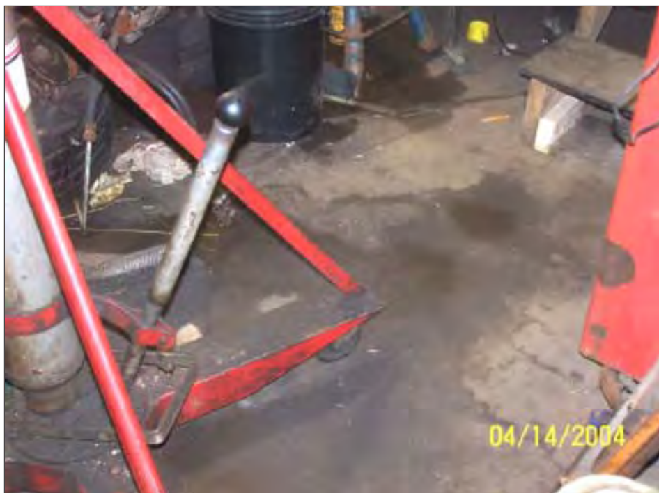
The wet floor shows the conditions under which employees have to work each time it rains.