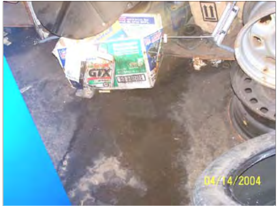
El piso del garaje municipal donde los empleados de la ciudad trabajan, mojado de la lluvia que penetra por el techo.