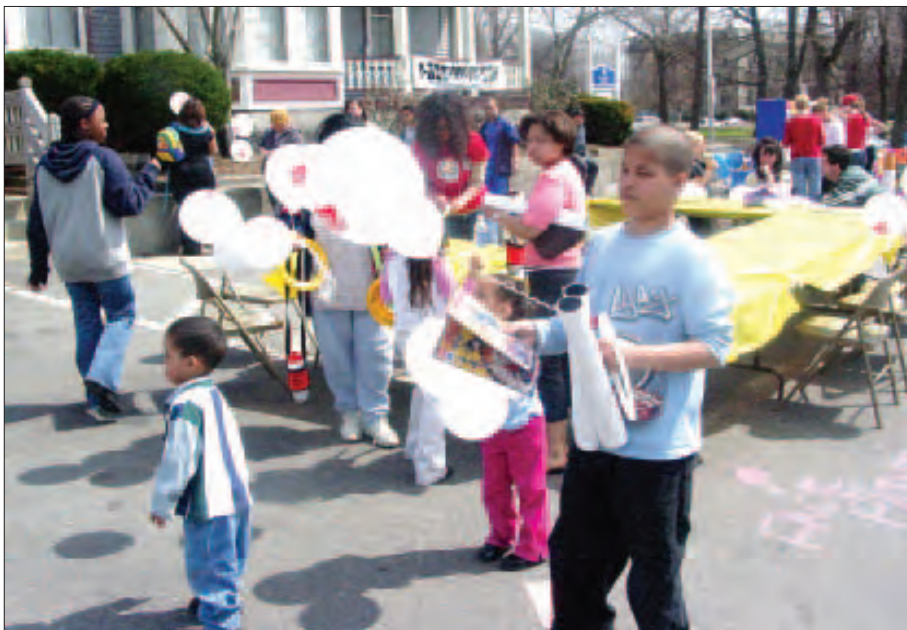
Otras vistas de voluntarios y público en general que asistieron a la feria.