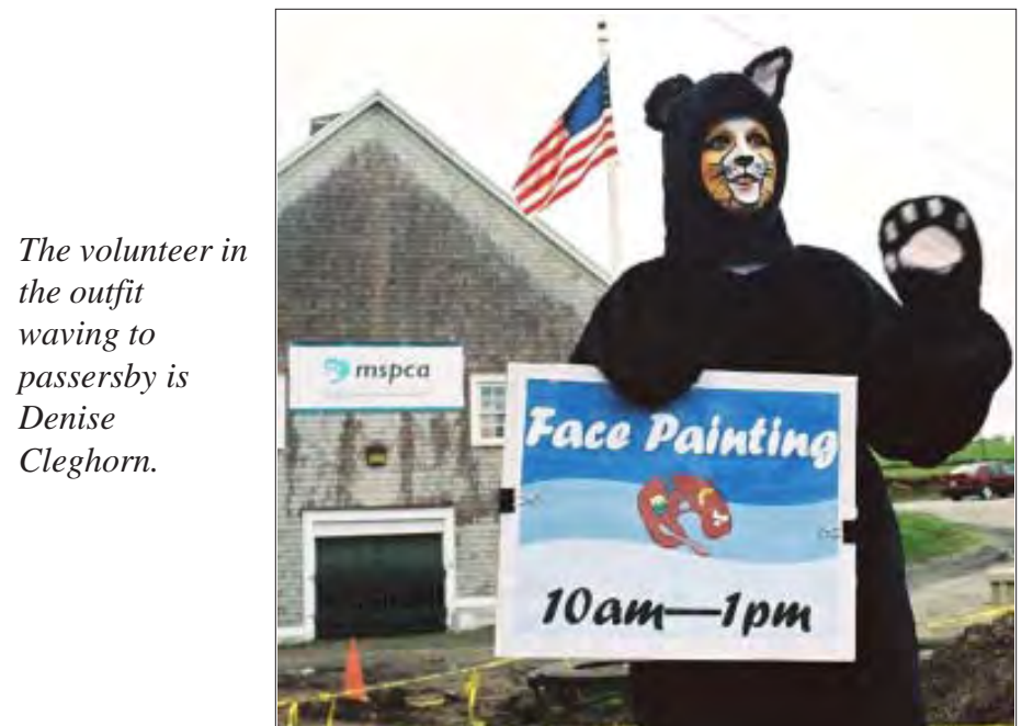
The volunteer in the outfit waving to passersby is Denise Cleghorn.

For more information call the LMCC offices at 978-975-8793.