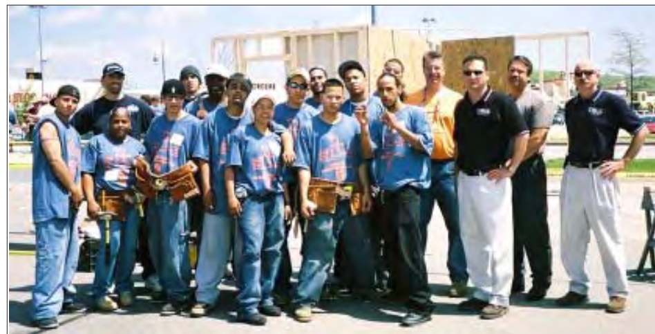
Participantes del equipo de YouthBuild Lawrence.