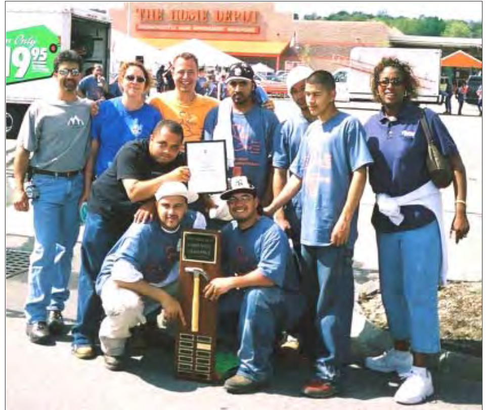
The winning team for this year's event came from New Britain, CT.

YouthBuild es un programa nacional comunitario para jóvenes entre 18 y 24 años de edad. YouthBuild trata de enfrentar los problemas más profundos de las comunidades de bajo ingreso: educación, vivienda, trabajo y desarrollo de liderazgo. Los participantes pasan el 50% de su tiempo en el programa logrando sus metas académicas mientras les proveen instrucción individualizada.