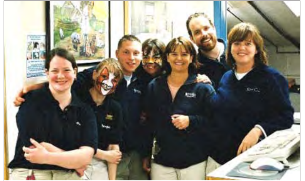
Group photo of staff and volunteers.