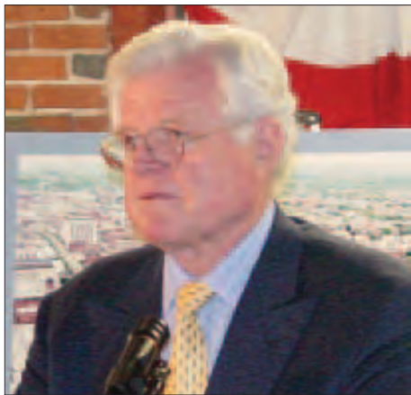
El Senador Edward Kennedy durante la presentación del $1.5M. El Congresista Marty Meehan habló sobre la visita de ambos a Casa Dominicana y la necesidad que los dominicanos confrontan.