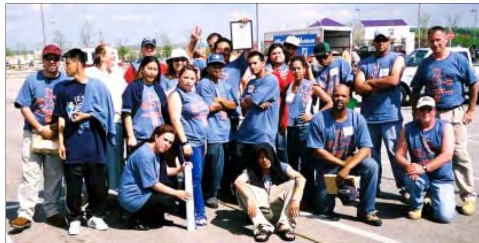
The group above is the second place winner, YouthBuild Lowell. Third place winners was YouthBuild Springfield.

YouthBuild is a comprehensive national youth and community development program for 18-24 year olds. YouthBuild addresses the core issues facing low-income communities: education, housing, jobs and leadership development. Young people build housing for homeless and low-income Lawrence residents. Participants spend 50% of their program time pursuing academic goals while receiving individualized GED instruction.