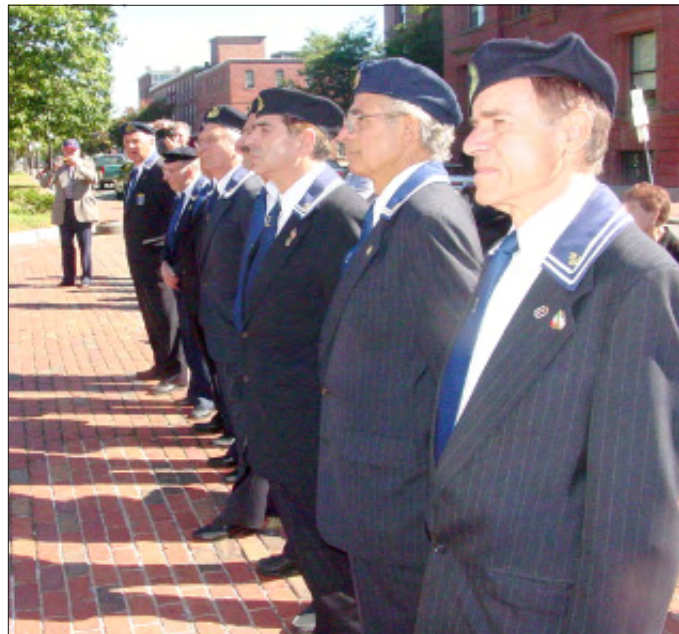
Un grupo de Veteranos de la marina italiana parados en formación durante el izamiento de la bandera.

mundo a una recepción efectuada en el Centro de visitantes del Heritage State Park, en el 1 de la Calle Lawrence, 3r. piso.