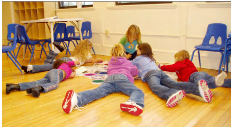
Un día lluvioso es el momento ideal para que las niñas se reúnan en la YMCA para trabajar en proyectos de manualidades.