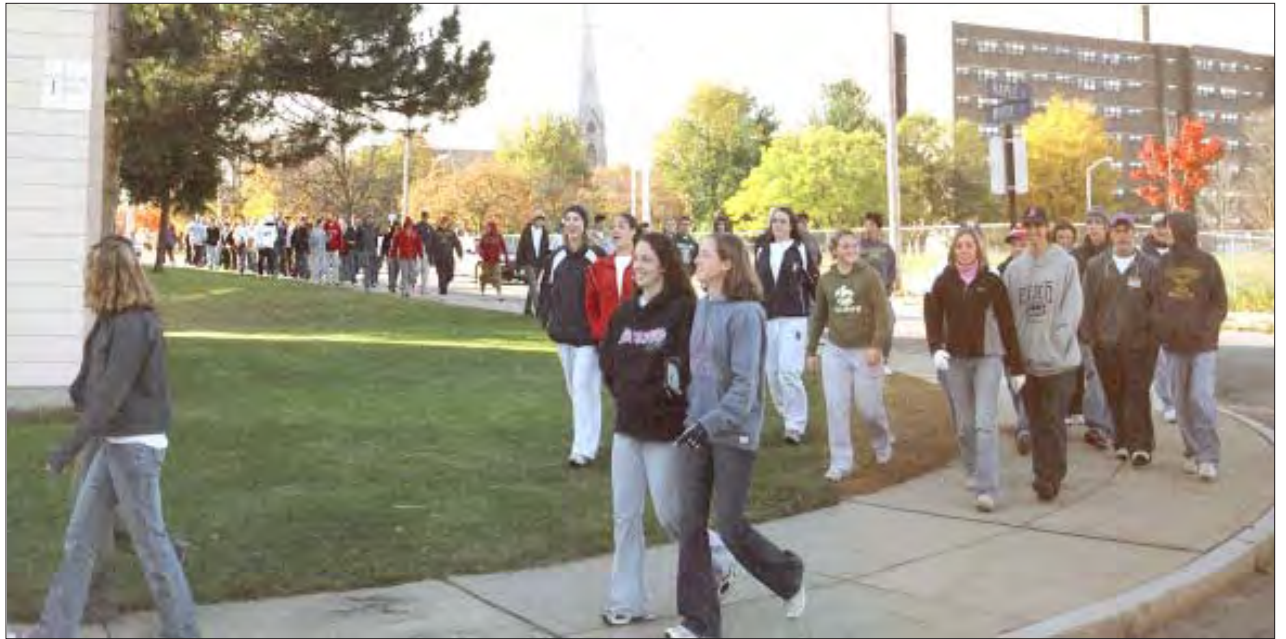
Estudiantes de Central Catholic caminan a lo largo de las calles Maple y White.

Central Catholic también es atractivo para algunos viejos alumnos y partidarios de la escuela, a quienes se les ofrecerá la posibilidad de poseer un pedazo conmemorativo