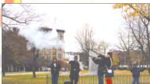
Miembros de la Guardia de la Guerra Civil, disparan sus mosquetes en señal de saludo a los veteranos. Members of the Civil War Memorial Guard fired a round in salute to the veterans.