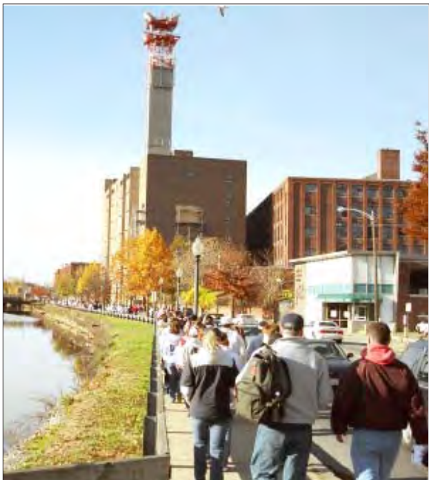
Los estudiantes caminan a lo largo del canal.

del piso. Si se recaudarán suficientes fondos, un nuevo piso será instalado en el verano del 2005.