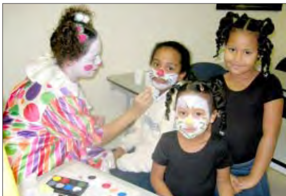
Como era de esperarse, los muchachos tuvieron una parte muy importante en la celebración.

Sobre los últimos dos años el centro de Mirabal ha servido a más de 60 mujeres minoritarias en Lawrence a través del GED y cursos básicos de inglés. Las participantes son animadas a matricularse en cursos pre-universitarios o programas académicos en Northern Essex Community Collage y las que estén interesadas reciben ayuda personal con los costos iniciales de