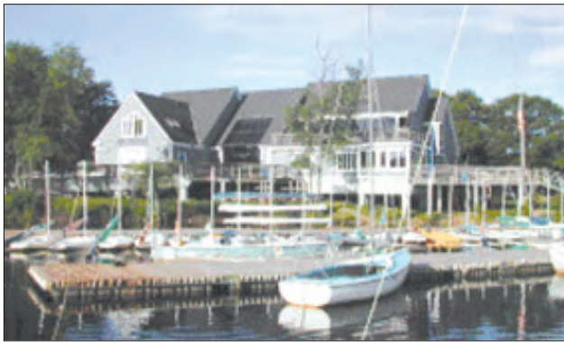
Regatta Headquarters: Bashara Boathouse, 1 Eaton St., Lawrence

Please join us for the 3 rd Annual Lawrence Celebration Regatta Saturday, June 11, 2004 On the beautiful and historic Merrimack River in Lawrence, MA