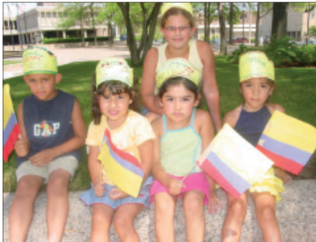
Un grupo de pequeños del day care "Mis Primeros Momentos", vinieron a celebrar el Día de la Independencia.

La siguiente composición fotográfica muestra algunos detalles de la celebración.