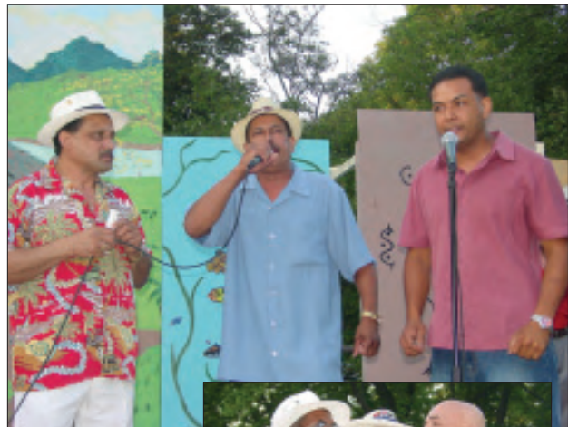
Los trovadores improvisaron décimas usando como pie forzado "Boricua de Corazón".