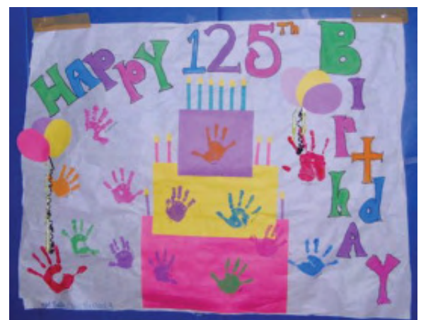
the children of the YMCA's Ballard Way Child Care & Enrichment Center helped decorate the walls of the gymnasium with birthday party artwork.