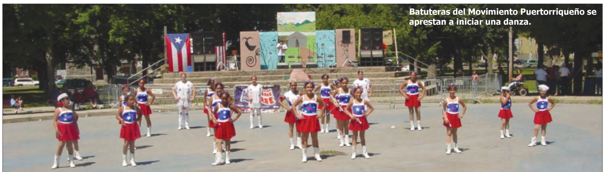
Batutas del Movimiento Puertorriqueño se aprestan a iniciar una danza.