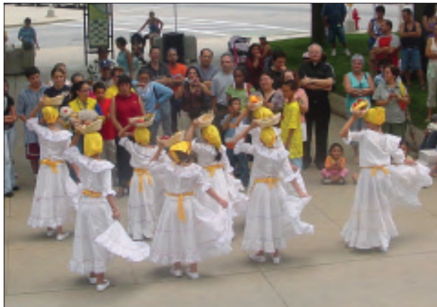
El Grupo Raíces de Colombia baila para deleite del público allí reunido.