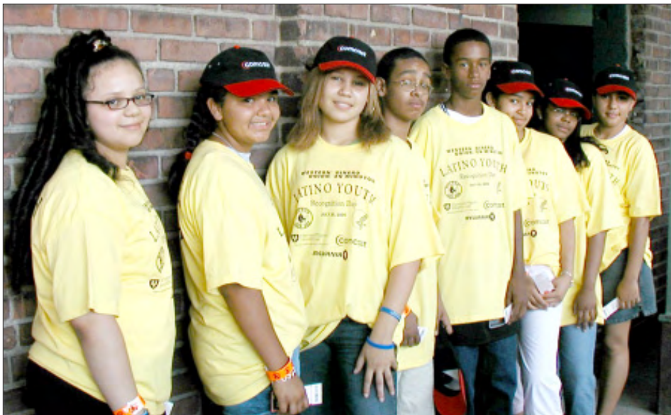
Estudiantes de Lawrence que fueron reconocidos ese día por sus notas sobresalientes y buena asistencia a la escuela.