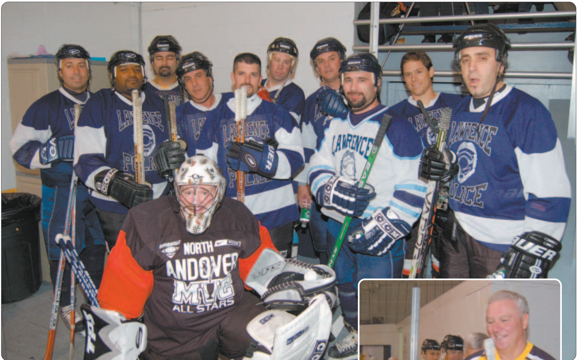
Miembros de la Liga Atlética de la Policía de Lawrence.