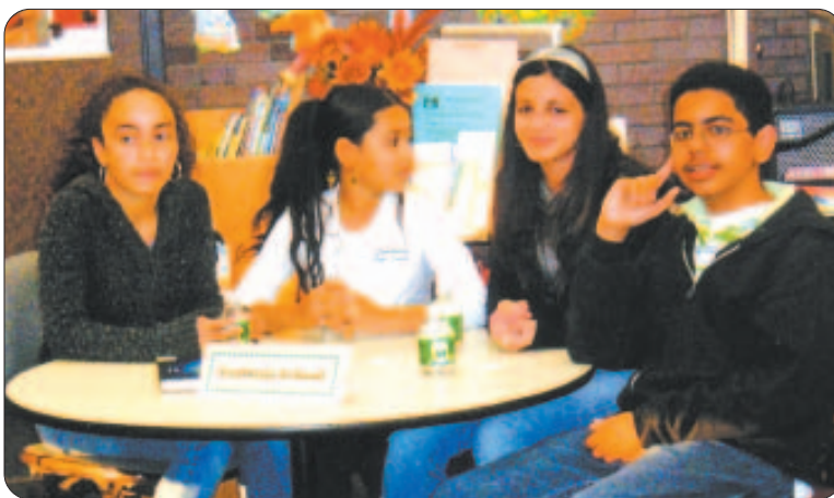
El equipo de la escuela Parthum en las preliminares del campeonato donde se enfrentaron al equipo de la escuela Henry K. Oliver.